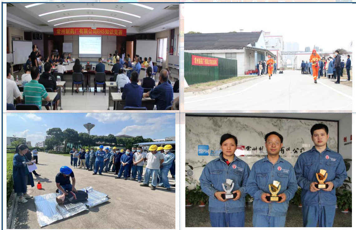
图 7-1 安全活动

员工是企业最宝贵的财富，企业的发展离不开员工。公司一直以来都把安全生产、职工劳动保护工作当作一切工作中的重中之重，切实维护职工的生命安全和职业健康。为进一步加强企业安全工作，营造“安全管理，人人有责”的良好氛围，树立安全为天的思想意识，公司持续开展三级安全教育，2022年新员工培训107人次和日常培训5615人次，组织38人次参加应急管理部门安全管理人员专项培训，特殊工种取证21人次，同时，持续推动“安全文化”宣贯，旨在使安全生产管理深入人心，进一步提高全体干部职工的安全意识和责任意识，形成“安全生产，以人为本”的共识。2022年6月，公司开展“2022年安全生产月、环境日和夏季”活动，以“EHS知识竞赛”为主线，结合“我是安全吹哨人”、“生命救助”、“安全行为观察”等活动，不断夯实安全基础，提高基层员工的安全意识，推动公司安全生产工作再上新台阶。2022年11月，公司开展“2022-2023年冬春季安全生产百日无事故”活动，以“车间岗位隐患排查整改评比”活动为主线，结合“安全生产事故案例征集”、“消防实战比赛”等活动，深入开展隐患排查治理和安全督查工作，宣传安全生产方针政策，图7-1。