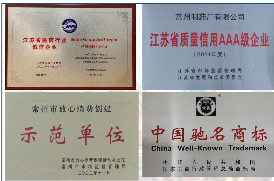
图 5-1 信用建设成果

公司一直将信用管理工作作为公司日常管理的一项重要工作内容坚持开展，在市场经济日益发达的现代社会，我们深知“守合同重信用”是企业生存发展之本，企业的信用资质已成为企业在市场竞争中不可或缺的重要标签。公司始终坚持以诚为本，以信迎客，得到了广大客户的积极评价和充分信赖。公司连续被国家工商总局评为“守合同、重信用”企业、“中国制药行业信用管理 AAA 级企业”、“江苏省价格诚信企业”以及“常州市放心消费创建示范企业”；“常药”商标荣获中国驰名商标称号，见图5-1。