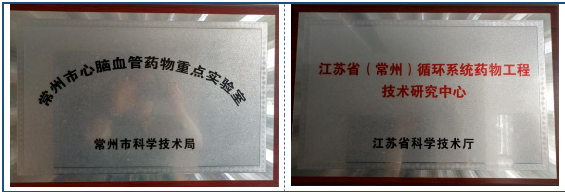
图 4-1 技术领域荣誉

公司每年投入科研经费占全年销售收入的 8% 以上，常年开展研发项目超过 80 个，并承担十二五国家重大科技专项、国际科技合作计划、江苏省科技成果转化等项目若干。公司主要产品盐酸多西环素、氢氯噻嗪、马来酸依那普利片、卡托普利片、沙利度胺片等，均系江苏省高新技术产品，“替米沙坦氢氯噻嗪片”等四个项目曾获评“国家重大新药创制”科技重大专项，获得国家财政专项支持。2021 年，公司荣获了中国化学制药行业工业协会授予的多项荣誉，包括“原料药出口型优秀企业品牌”、“制剂出口型优秀企业品牌”、“抗肿瘤和免疫调节剂类优秀产品品牌”和“原料药优秀产品品牌”称号，图 4-2。