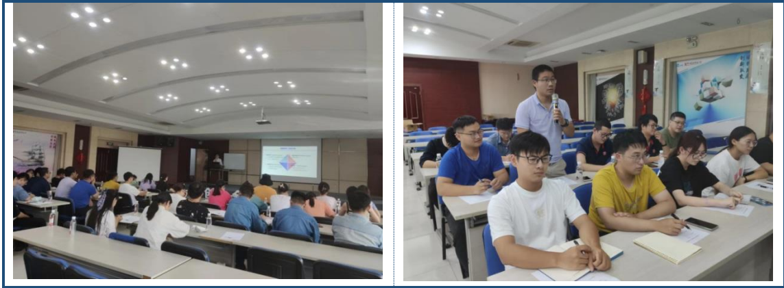
图 8-2 员工培训方面