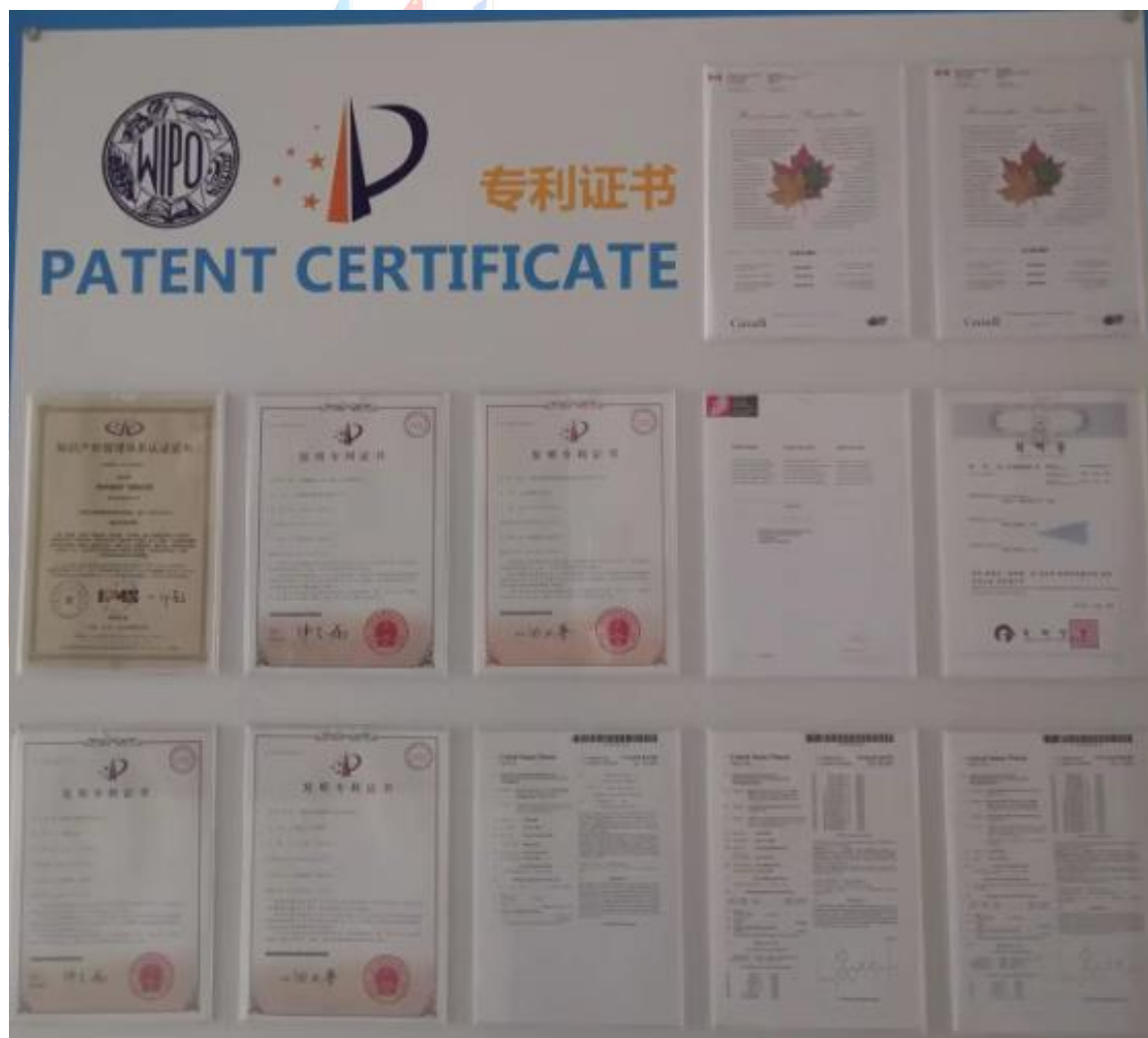
图 4-3 部分专利展示

截至 2022 年 12 月 31 日，公司共计拥有国内外授权专利 72 件，申请发明专利 186 件。在产品注册申报方面，近年来，公司在国内累计申报原料药品种 24 个，其中 7 个产品已获批（注册状态转 A）；在国内累计申报仿制药（含联合申报及一致性评价品种）25 个，其中 5 个仿制药新产品已获批、6 个质量与疗效一致性评价品种已过评；在国际上累计注册/备案原料药（规范市场）29 个；在国际上累计申报仿制药 7 个，其中 5 个已获批。