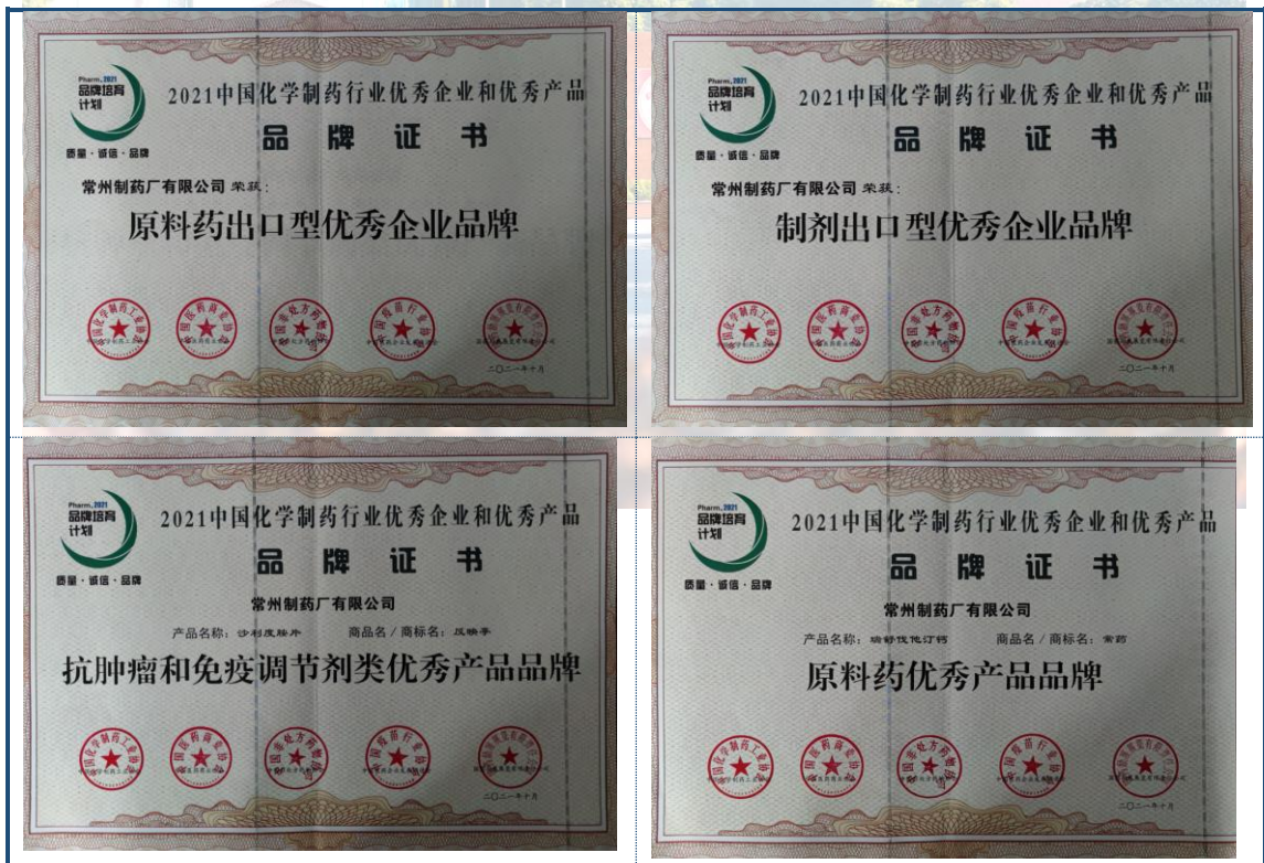
图 4-2 企业产品及品牌荣誉

公司每年投入科研经费占全年销售收入的 8% 以上，常年开展研发项目超过 80 个，并承担十二五国家重大科技专项、国际科技合作计划、江苏省科技成果转化等项目若干。公司主要产品盐酸多西环素、氢氯噻嗪、马来酸依那普利片、卡托普利片、沙利度胺片等，均系江苏省高新技术产品，“替米沙坦氢氯噻嗪片”等四个项目曾获评“国家重大新药创制”科技重大专项，获得国家财政专项支持。2021 年，公司荣获了中国化学制药行业工业协会授予的多项荣誉，包括“原料药出口型优秀企业品牌”、“制剂出口型优秀企业品牌”、“抗肿瘤和免疫调节剂类优秀产品品牌”和“原料药优秀产品品牌”称号，图 4-2。