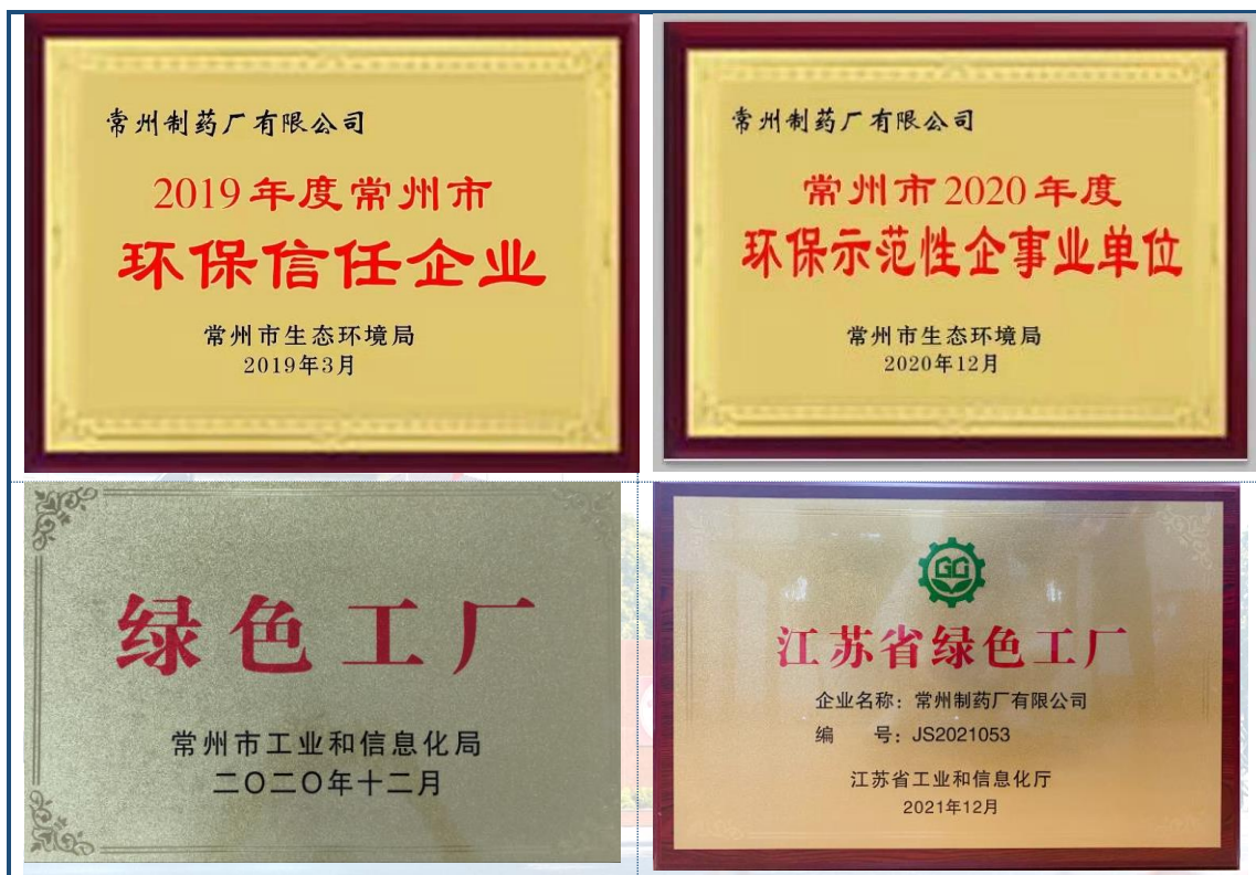
图 6-1 环保相关荣誉

行了量化，并向社会公布。公司一直以来以减少环境污染，排放治理和设计双达标的环保工作目标，按照“规划环境管理、满足法律法规、排放达标受控、持续节能降耗”的工作方针，以 PDCA 循环为手段，以“节能、降耗、减污、增效”为持续改进目标，实现对环境因素的控制，达到绿色排放，从而使企业在可持续发展的道路上稳步前行。公司先后被评为“环保信任企业”、“常州市环保示范性企业”；荣获“常州市绿色工厂”和“江苏省绿色工厂”称号，见图6-1。