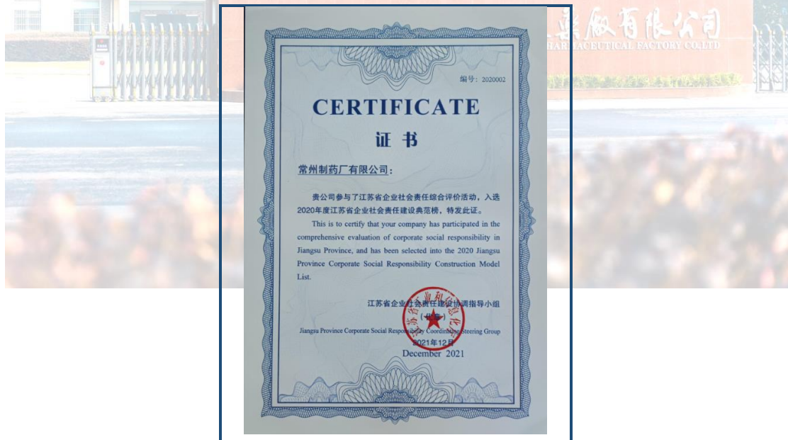
图 9-1 省社会责任典范榜

一个卓越企业既要考虑当前利益，更重要的是着眼长远可持续发展。而长远发展和持续经营，离不开社会的协同、和谐与发展。认真履行社会责任是不可小视的重要内容。常州制药厂有限公司在追求经济效益、保护投资方利益、不断发展的同时，积极履行公共责任及恪守道德规范，保护职工的合法权益，诚信对待供应商、客户，做到以公司的健康发展实现投资方、员工收益同步成长，让客户满意、社会放心，从而促进公司与社会的协调、和谐发展。公司入选江苏省企业社会责任建设典范榜。