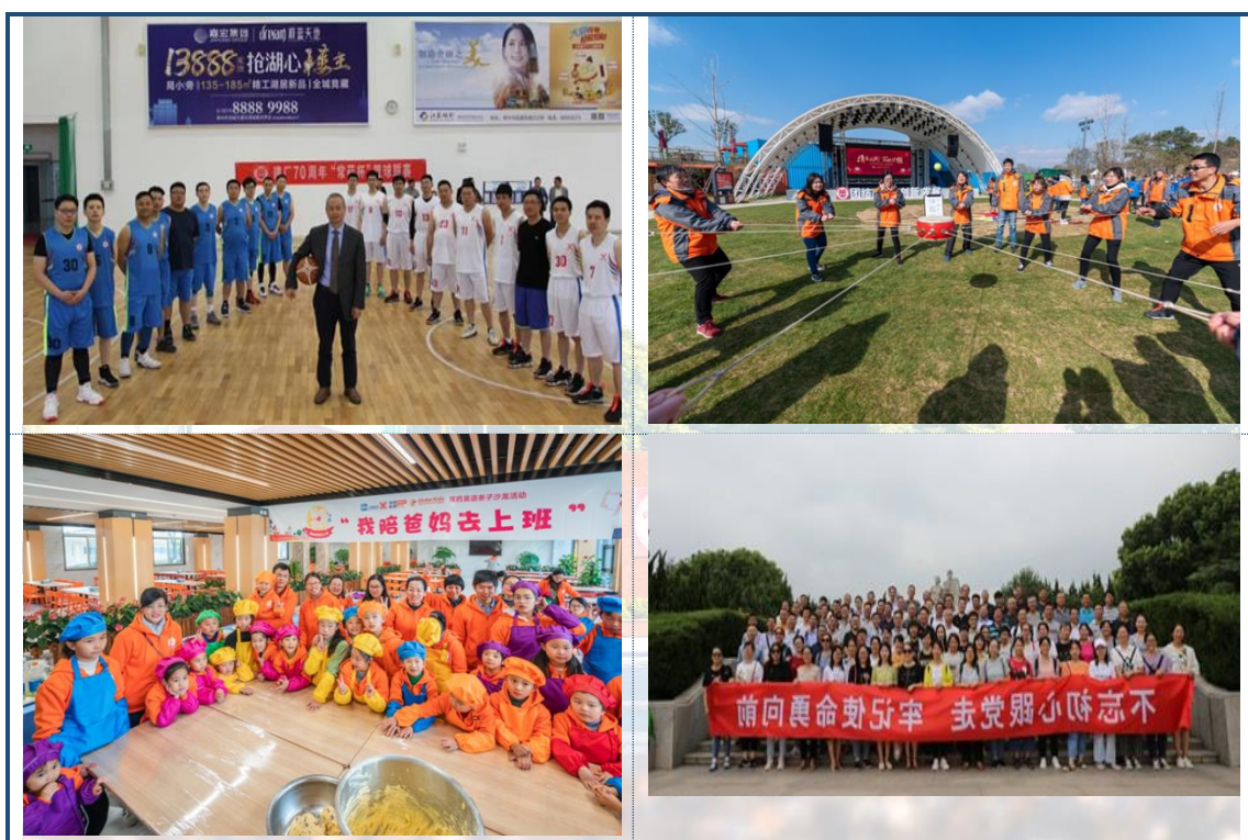
图 8-1 员工活动精彩瞬间

营活动选拔有兴趣、有基础、有需求的员工积极参加线上口语积分打卡，参加线下 free talk 和沙龙，进一步提高他们的英语能力，培养学习习惯。一年一度的新员工入职培训活动也于每年7月中旬举行，活动向新员工们展示了“文化常药”、“创新常药”、“品牌常药”和“安全常药”四个方面，让他们印象深刻。党委活动也层出不穷，开展各类红色教育主题和廉洁从业主题参访活动，增强员工爱国主义情怀提高员工廉洁从业意识，不忘初心，奋发有为，更好地投入工作。工会通过先进集体、先进个人和工会积极分子的评选表彰活动，宣传员工的优秀事迹，弘扬员工身上所体现的企业精神，并通过精神、理念、传统等无形的因素，陶冶员工的情操，培养员工群体意识和良好的共同习俗和道德风尚。